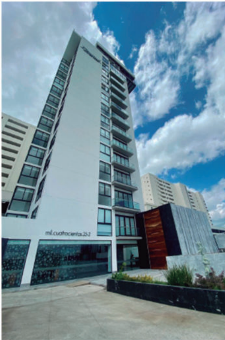
PLENITUD VALLE REAL SELECT