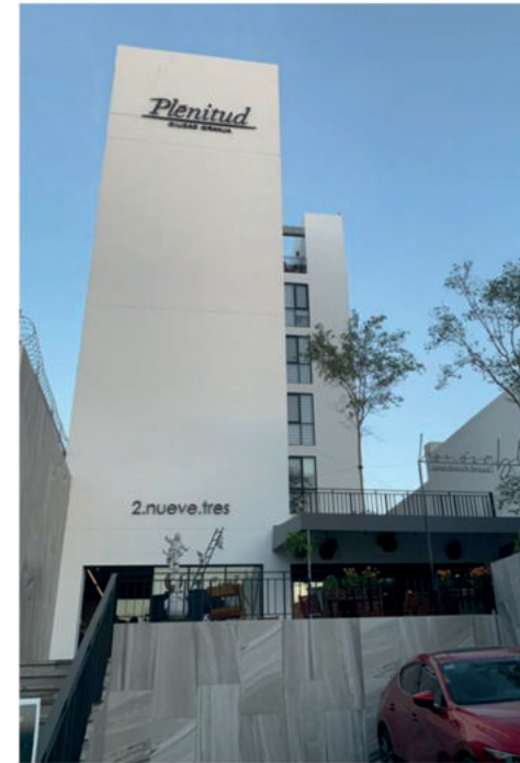
PLENITUD CIUDAD GRANJA